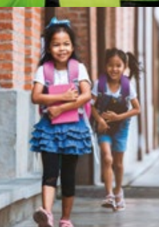
Tabela e përmbajtjes